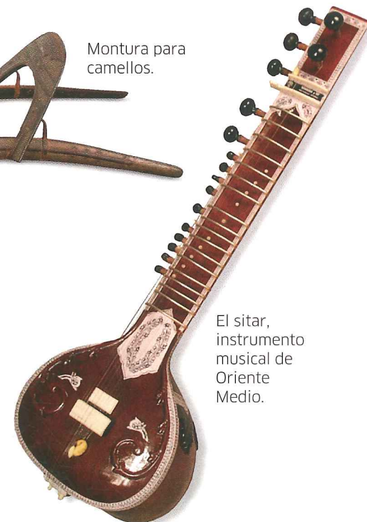
El sitar, instrumento musical de Oriente Medio.