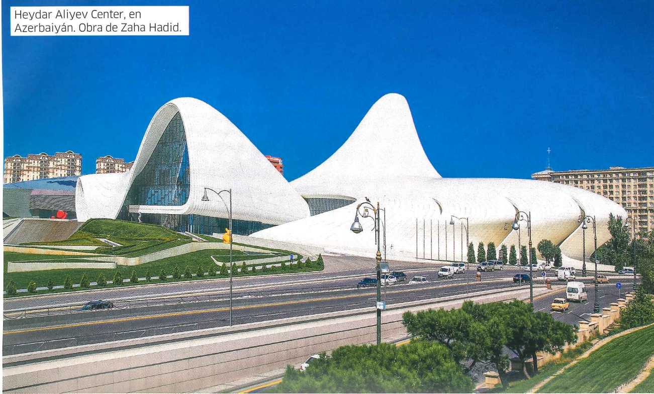
Heydar Aliyev Center, en Azerbaiyán. Obra de Zaha Hadid.