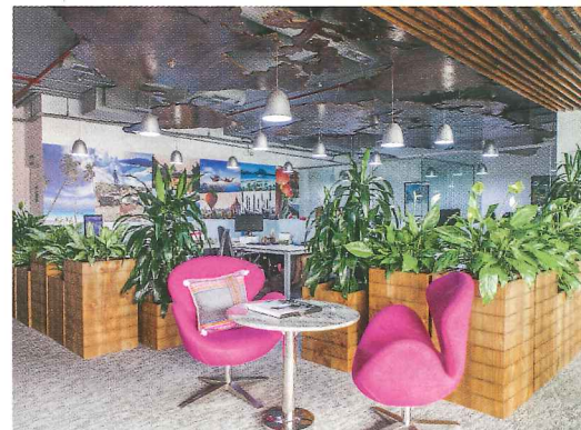
Oficina de la agencia de Viajes Rosario.